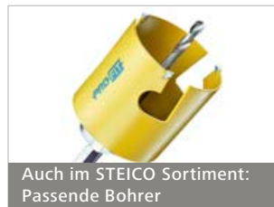
Auch im STEICO Sortiment: Passende Bohrer