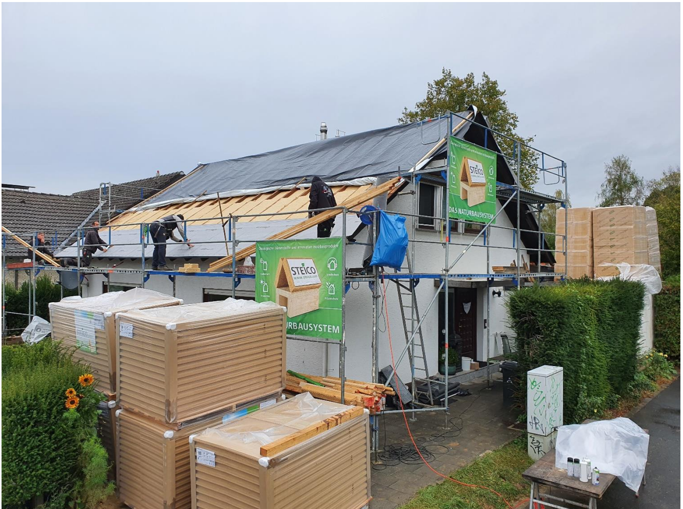
Abb. 4: Energetische Dachmodernisierung eines Einfamilienhauses von außen, ebenfalls mit der STEICOflex 036 als Zwischensparrendämmung.