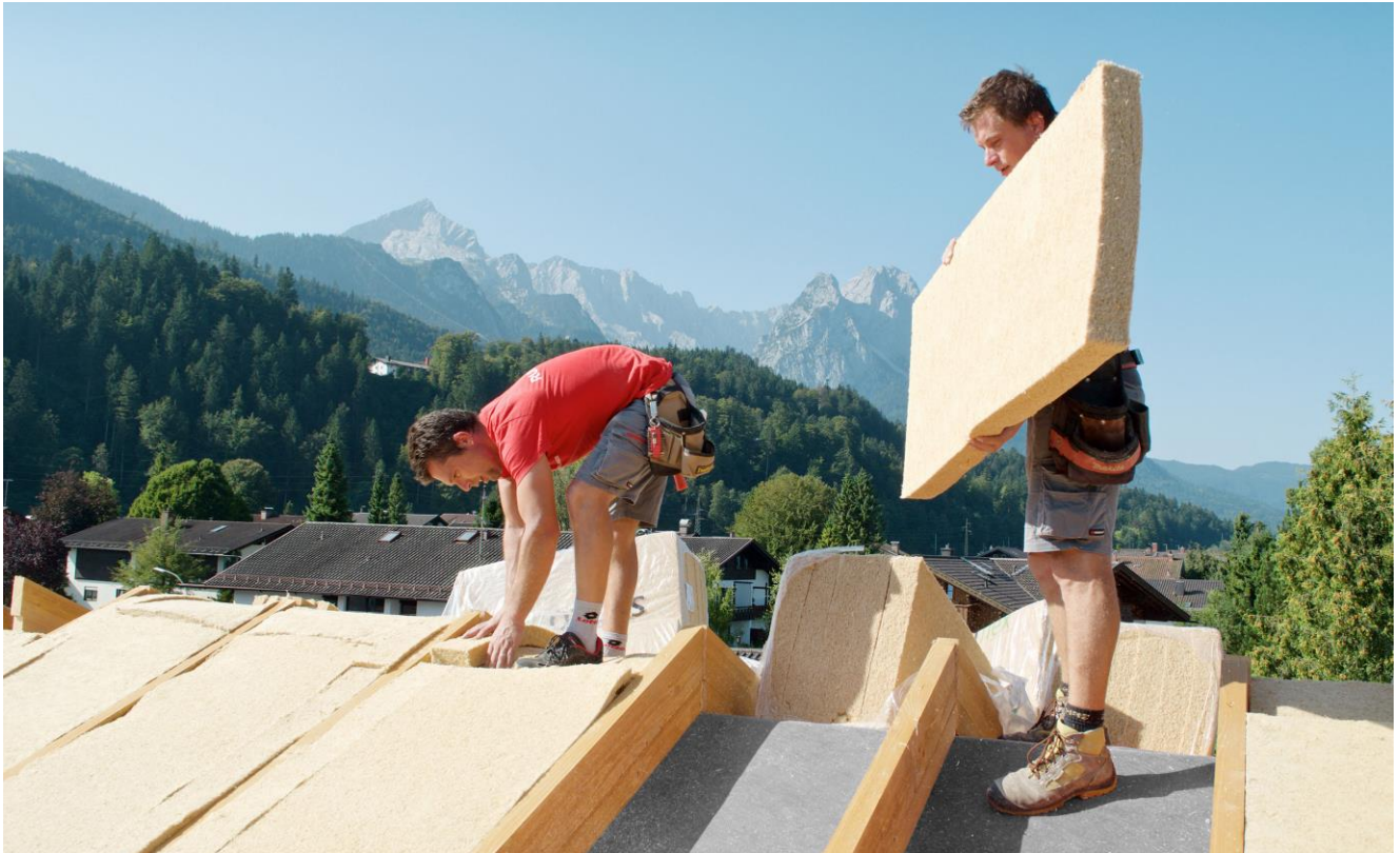
Abb. 3: Dämmung eines Neubaus von außen mit der Holzfaser-Dämmmatte STEICOflex 036 als Zwischensparrendämmung.