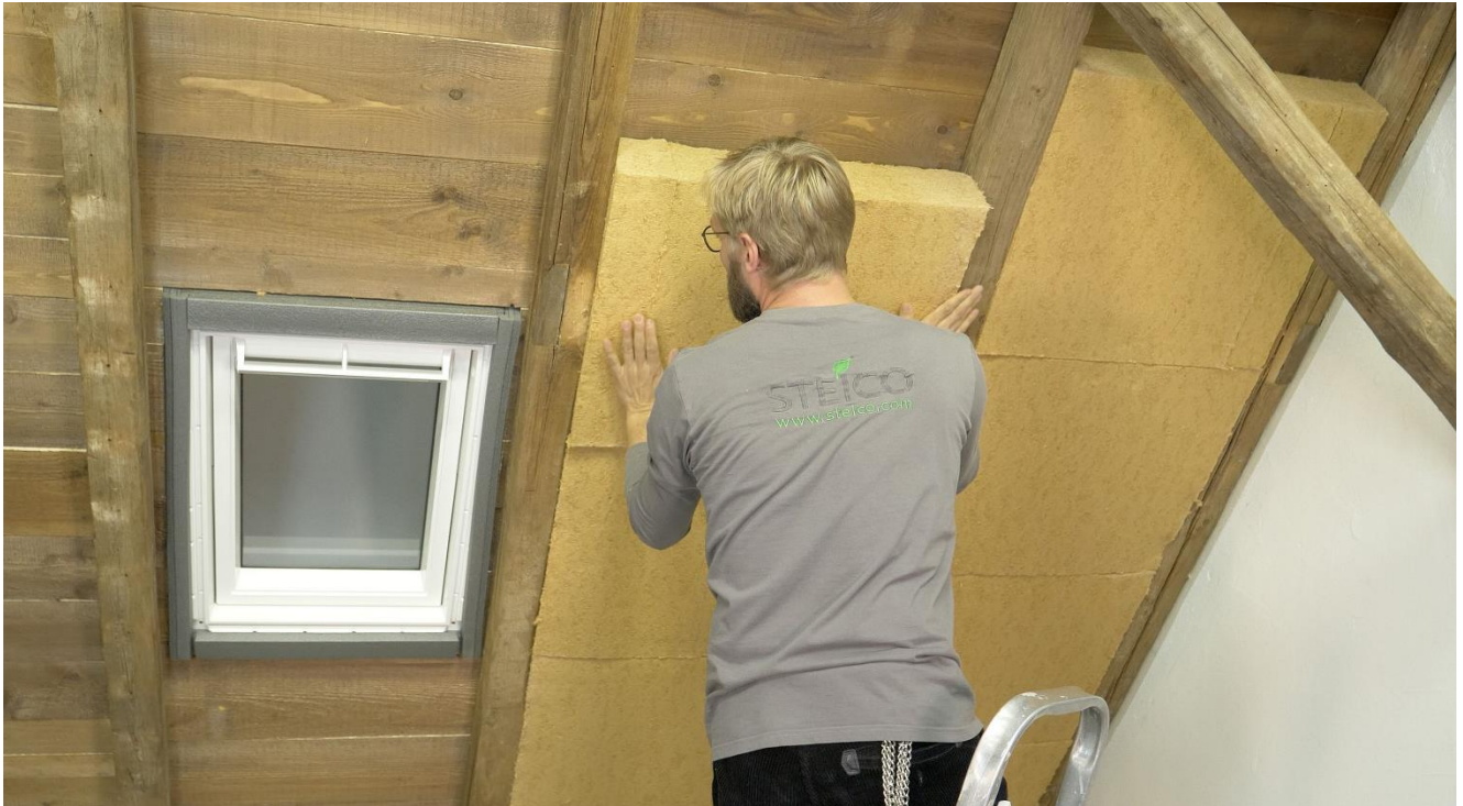
Abb. 2: Energetischen Modernisierung eines Bestandsdachstuhls von innen mit der Holzfaser-Dämmmatte STEICOflex 036 als Zwischensparrendämmung.