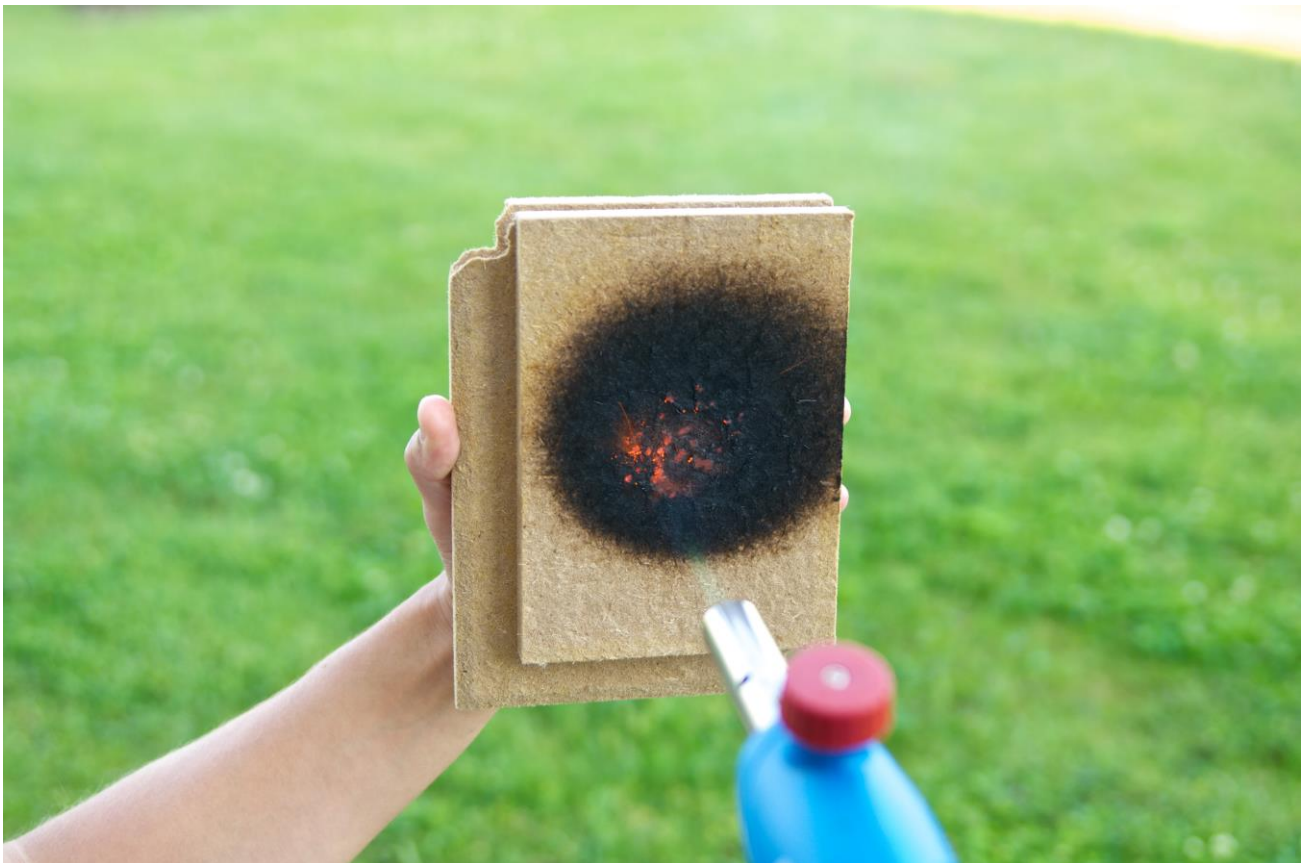
Abb. 8: Holzfaser-Dämmstoffe bilden bei Feuer sofort eine Kohleschicht und verbrennen anschließend relativ langsam mit geringer Rauchentwicklung und ohne abzutropfen.

Tendenziell hängen diese beide Eigenschaften schon zusammen, jedoch nicht streng analog, denn der Dämmvorgang ist komplex: Die Wärmeübertragung erfolgt nicht nur durch Wärmeleitung im Material selbst, in unserem Fall in der Holzfaser, sondern auch durch Konvektion und Wärmestrahlung in den Zwischenräumen. Diese drei Herausforderungen muss ein Dämmstoff gleichzeitig meistern - und das können Holzfaser-Dämmstoffe erfahrungsgemäß hervorragend.