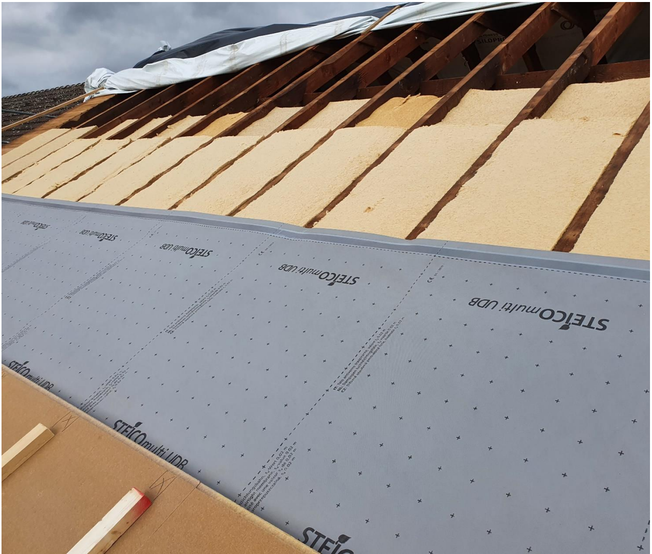
Abb. 6: Energetische Dachmodernisierung von außen. Interessanterweise konnte hier auf eine klassische Dampfbremse verzichtet werden, weil die Holzfaser-Dämmstoffe sehr feuchte-sorptiv sind und dafür sorgen, dass die Holzkonstruktion bei phasenweise hoher Dampfdiffusion trocken bleibt. Voraussetzung ist, dass die vorhandene Innenbekleidung ausreichend dampfbremsend ist.