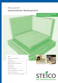
Planungshft Geschossdecke Bodensysteme