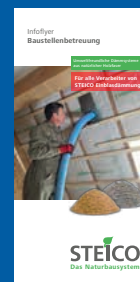
Infolyer Baustellen- betreuung