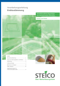
Verarbeitungs- anleitung Einblasdämmung